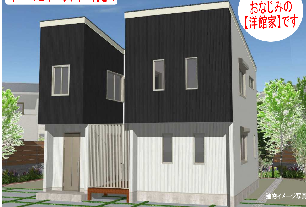
建物イメージ写真